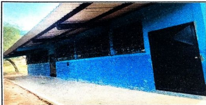
Foto 3: CABIO DE PINTURA INTERNO Y EXTERNO, COLOCACION DE BALCONES, SUSTITUCION DE VIDRIOS, SUSTITUCION DE PISO DE TORTA DE CEMENTO A PISO GRANITO.