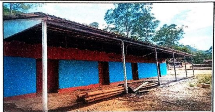
Foto 2: PARTE FRONTAL DE DOS AULAS PARA PINTAR Y SUSTITUCION DE PUERTAS DE METAL