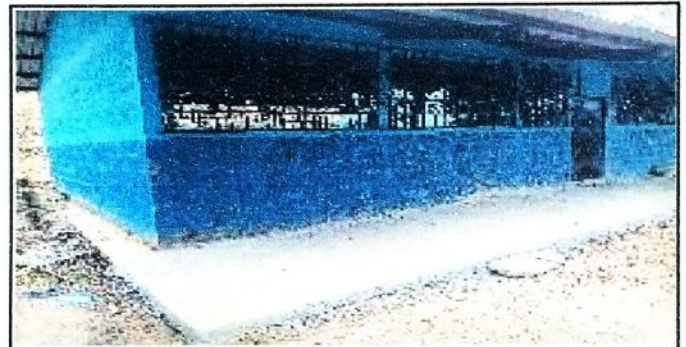
Foto 4: REMODELACION DE PISO TORTA DE CEMENTO A PISO DE GRANITO DEL CORREDOR